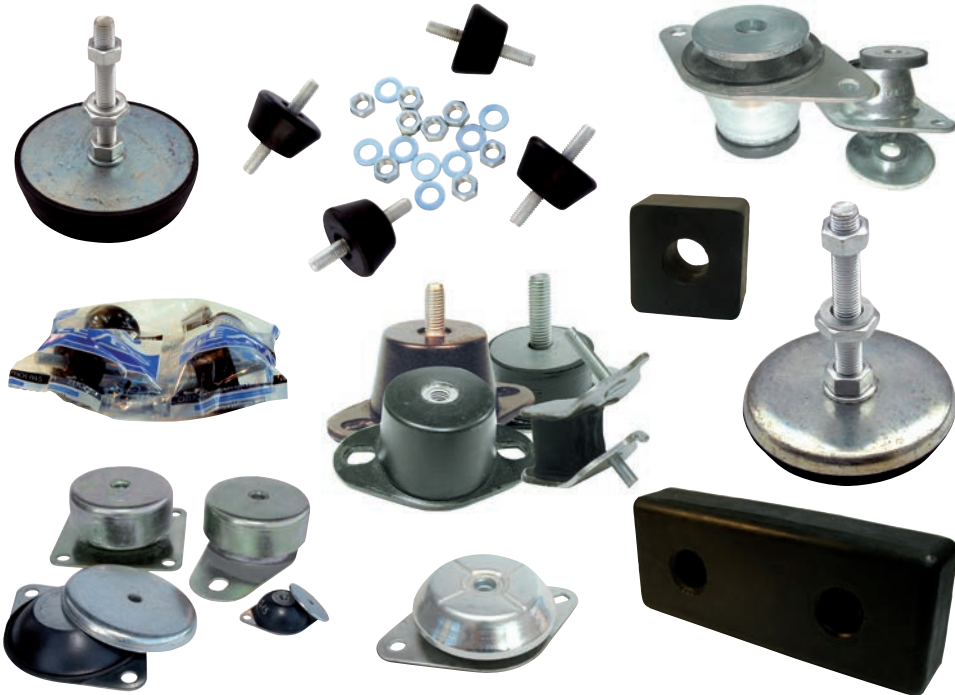
CAUCHO-METAL: Piezas de caucho-metal